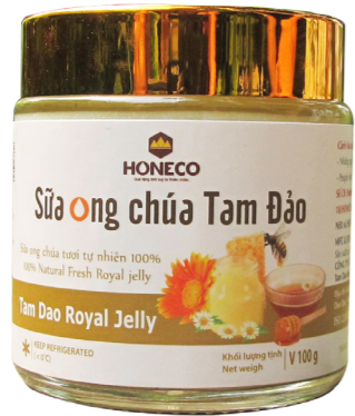
Sữa ong chúa Tam Đảo Tam Dao Royal Jelly