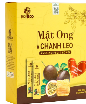
Mật ong Chanh Leo Passion Fruit Honey