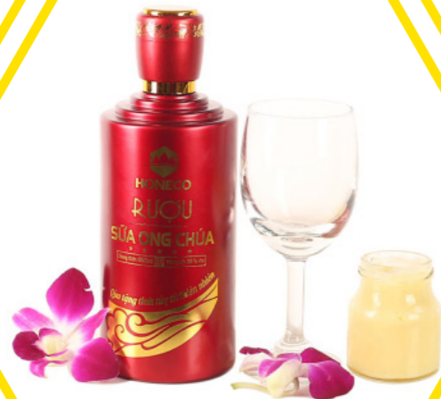
Rượu sữa ong chúa Royal Jelly alcohol