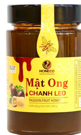
Mật ong Chanh Leo Passion Fruit Honey