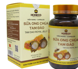
Viên sữa ong chúa Tam Đảo Tam Dao Royal Jelly Capsules