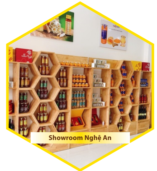
Showroom Nghệ An