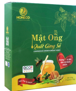
Mật ong Quất Gừng Sả Kumquat-Ginger-Lemongrass Honey