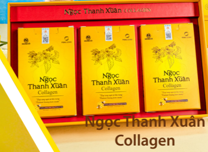
Ngọc Thanh Xuân Collagen