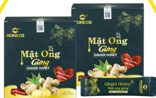
Mật ong Gừng Ginger Honey