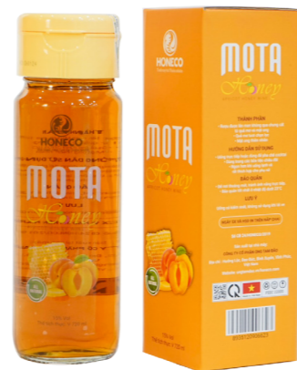
Rượu Mota Honey Apricot Honey Wine