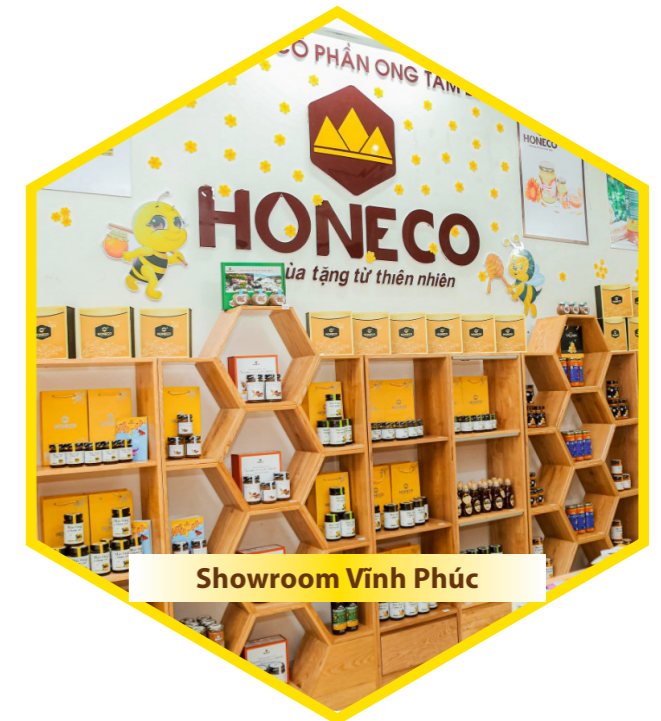
Showroom Vinh Phúc