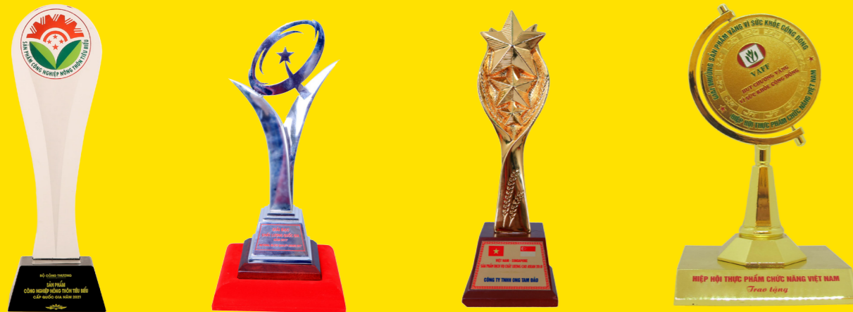
GIẢI THƯỞNG AWARDS OF THE COMPANY