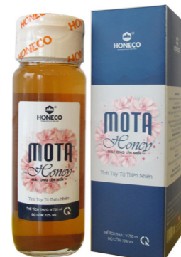
Rượu Mật ong lên men Ferment Honey Wine