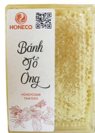
Bánh tổ Ong Tam Đảo Honeycomb Tam Dao