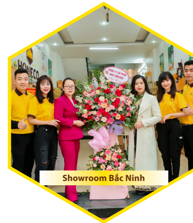
Showroom Bắc Ninh