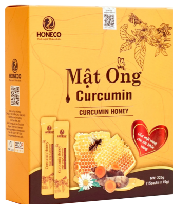
Mật ong Curcumin Curcumin Honey