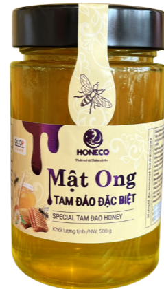
Mật ong Tam Đảo đặc biệt Special Tam Dao Honey