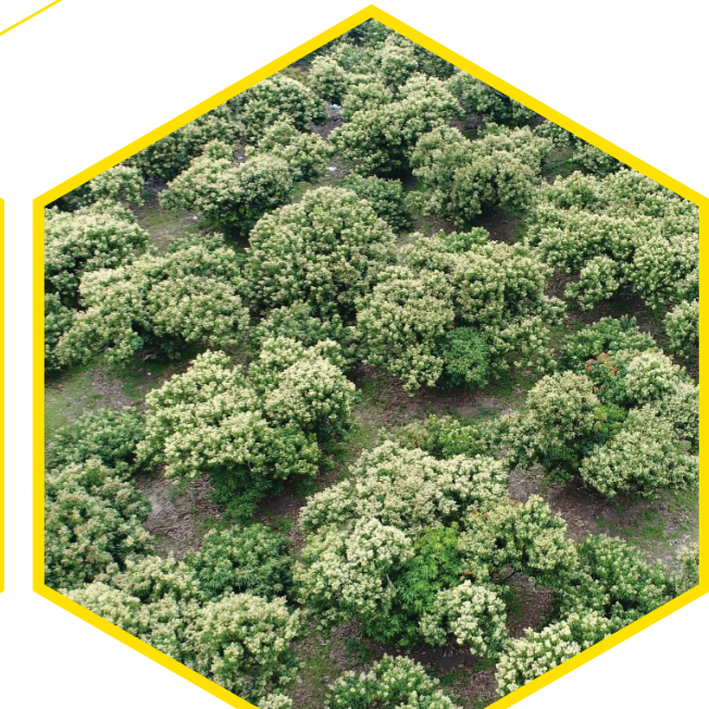
Vùng hoa vải (Litchi flower area)