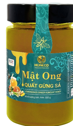
Mật ong Quất Gừng Sả Kumquat-Ginger-Lemongrass Honey