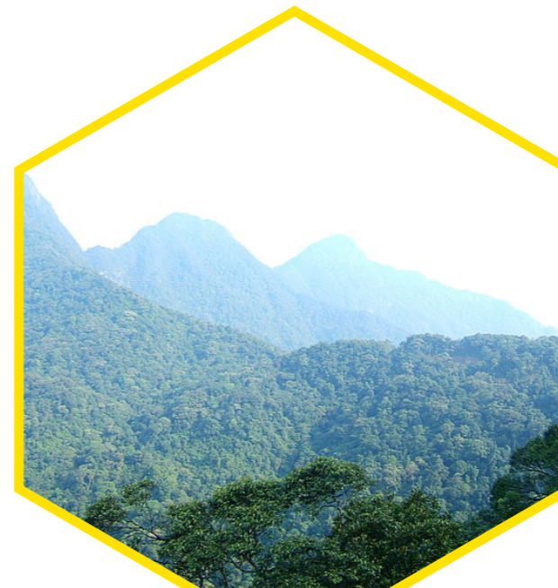
Vùng nguyên liệu rừng Tam Đảo (Tam Dao forest material area)