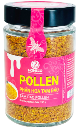
Phần hoa Tam Đảo Tam Dao Pollen