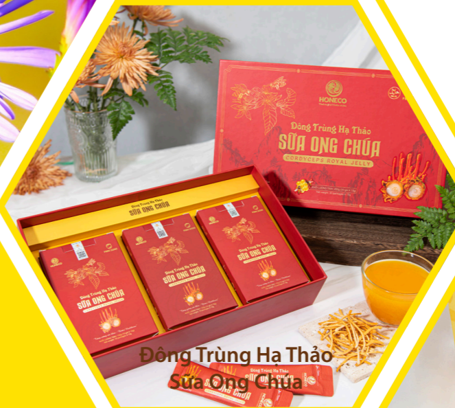
Đông Trùng Hạ Thảo Sữa Ong Chứa