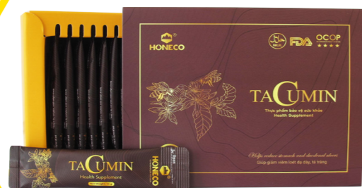
Tacumin 15g x 15 gói