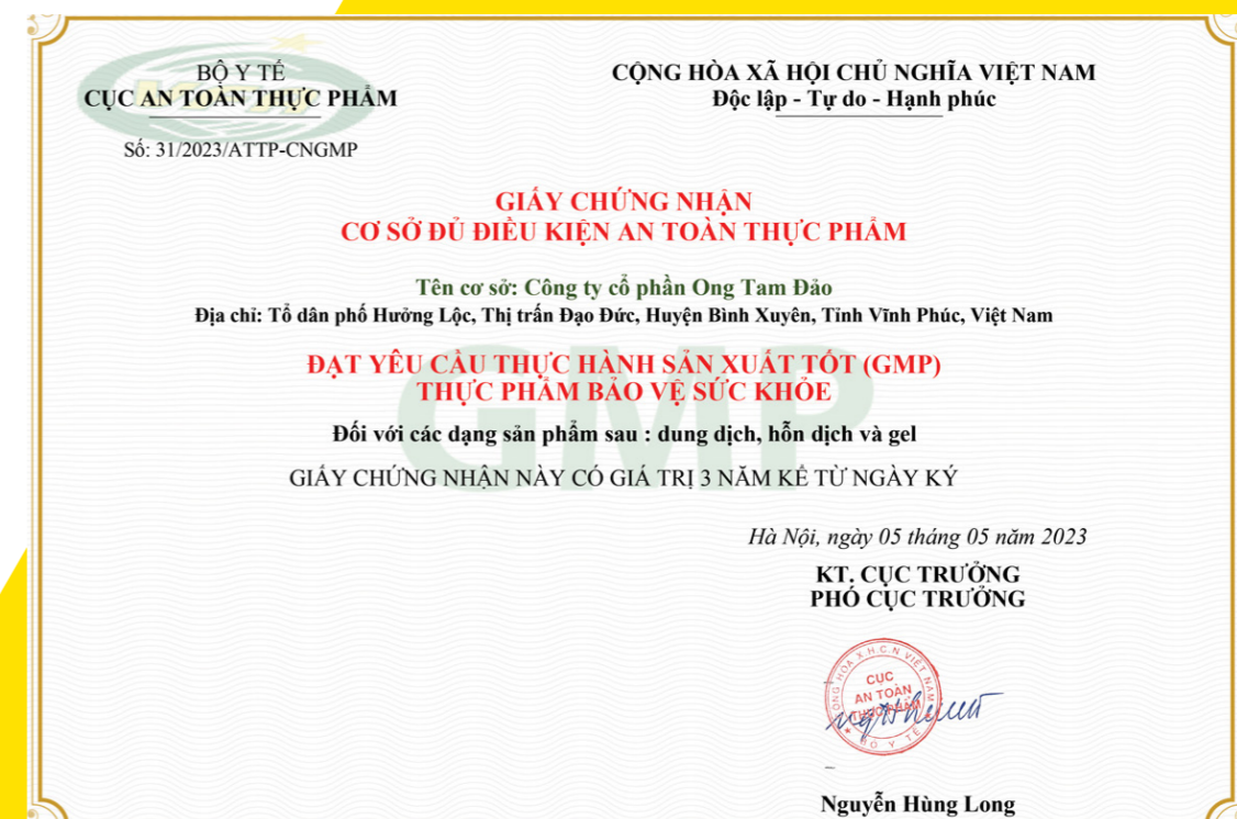
CHỨNG NHẬN GMP