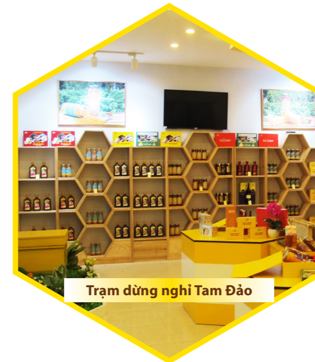
Trạm dừng nghỉ Tam Đảo