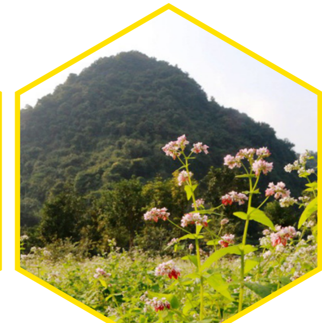
Nguồn mật rừng Tây Bắc (Northwestern nectar sources)