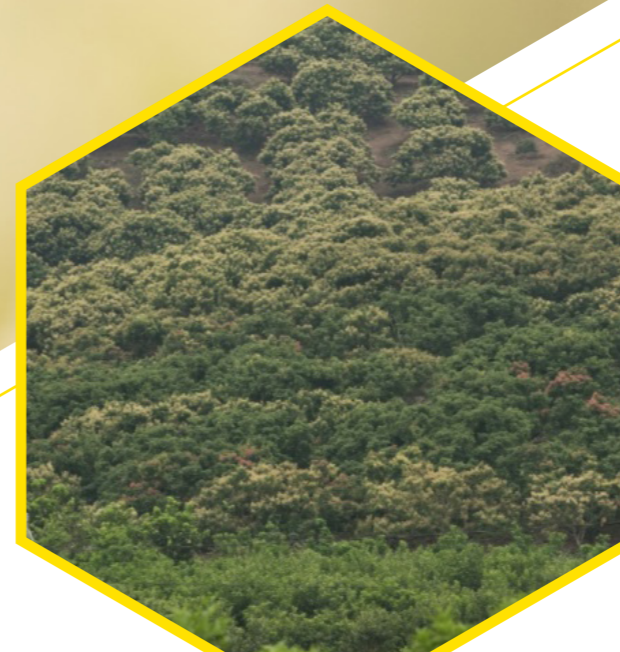
Vùng hoa nhãn (Longan flower area)