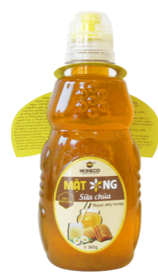
Mật ong Sữa Chứa Royal Jelly Honey