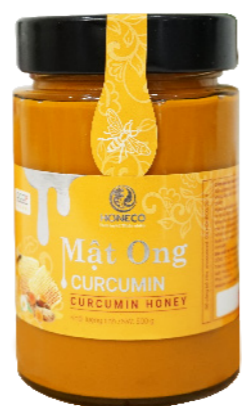
Mật Ong Curcumin Curcumin Honey