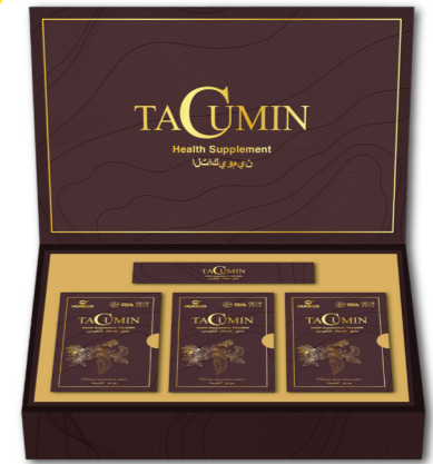
Hộp quà Tacumin 15g x 30 gói